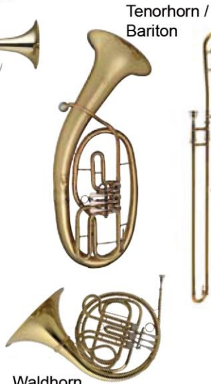
Tenorhorn / Bariton